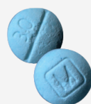
AUTHENTIC oxycodone m30 tablets*

Fake prescription pills are easily accessible and often sold on social media and e-commerce platforms making them available to anyone with a smartphone, including minors.