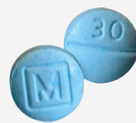
FAKE oxycodone m30 tablets*